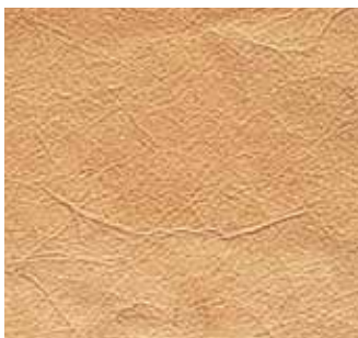
Adern Blood vessels

Die beschriebenen Materialmerkmale und die Empfindlichkeit dieses einmaligen Naturmaterials sind kein Reklamationsgrund.