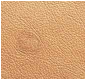
Zeckenbiss Insect bite