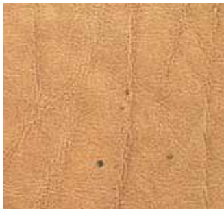
Mastfalten Fat wrinkles