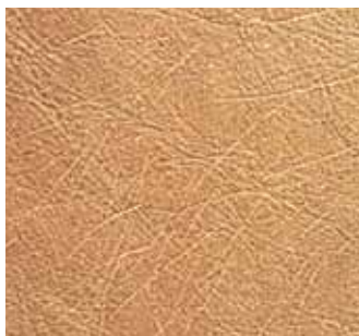
Heckenrisse Hedge scratches