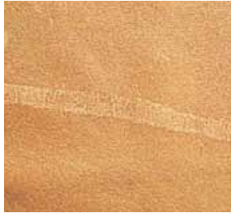
Hornstoß Horn butt