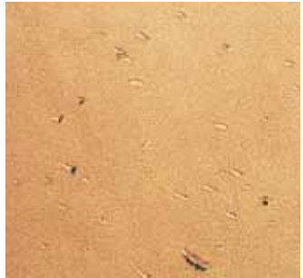
Treibstachel Prod marks