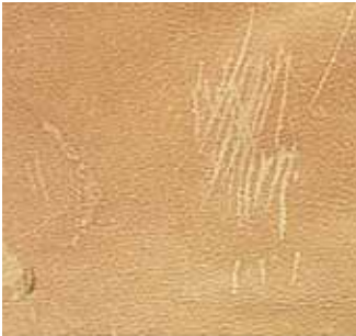
Striegelrisse Curry-comb scratches